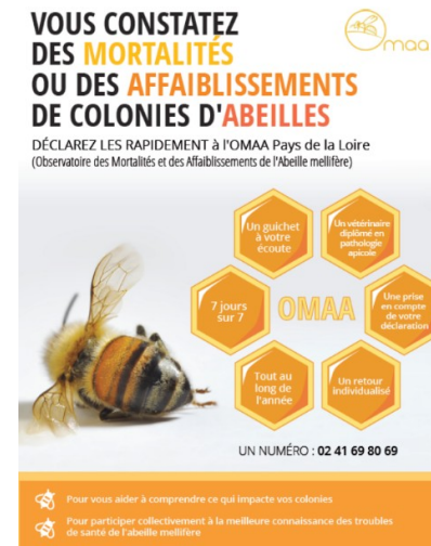
Exemple affiche OMAA Pays de la Loire